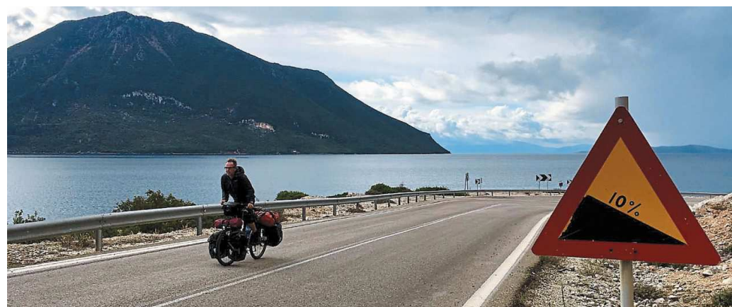
Parga, sur la côte ouest de la Grèce, au nord de Patras.

Pour suivre Stéphane Baud : unveloatourdu monde.com ou facebook.com/unveloatourdu monde/